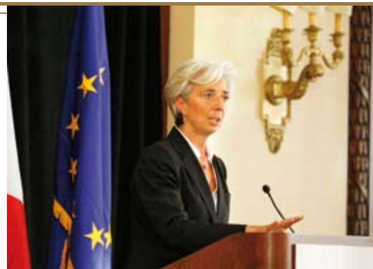
Mme Christine LAGARDE, Ministre de l'Economie, de l'Industrie et de l'Emploi.